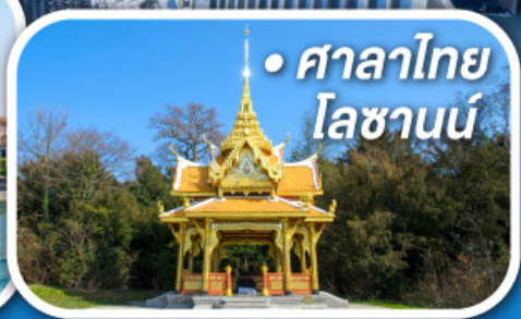
• ศาลาไทย โลซานน์

• สุดอากาศดีดีที่ซอร์แมก • ขึ้นกระเช้าสู่ยอดจากกลาเซียร์ 3000 • ชมเมืองคลาสสิกเบิร์น ลูเซิร์น ซูริค