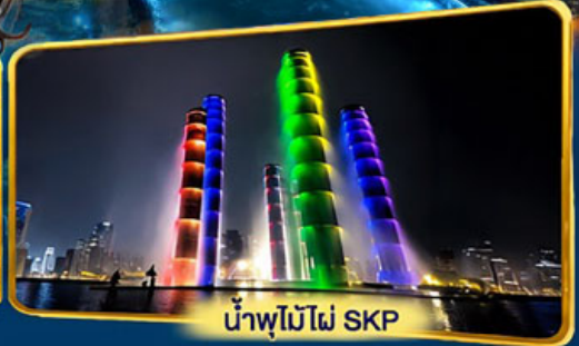
น้ำพุไม้ไฟ SKP