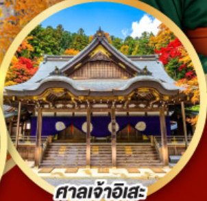
ศาลเจ้าอิสะ