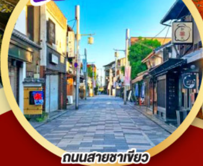
ถนนสายชาเขียว