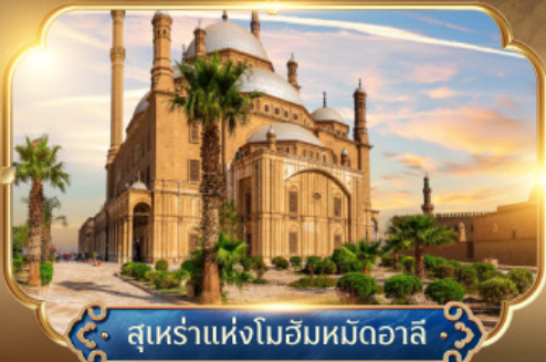
สุเหร่าแห่งโมอัมหมัดอาลี