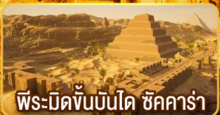
พีระมิดขั้นบันได ชัคคาร์่า