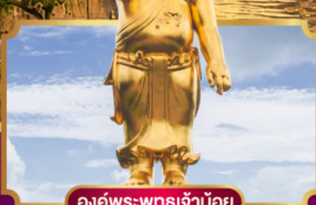
องค์พระพุทธรูปเจ้าน้อย