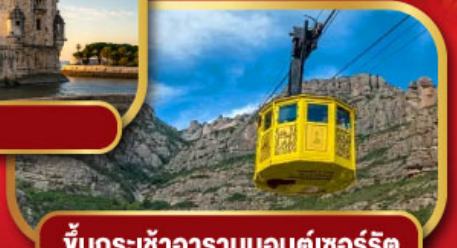
ขึ้นกระเช้าอารามมอนต์เซอริต