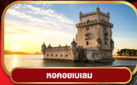
หอคอยเบเลม

ขึ้นกระเช้าไฟฟ้า อารามมอนต์เซอริต กับตำนาน Black Madonna