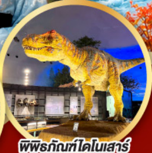
พิพิธภัณฑ์โตเกียว