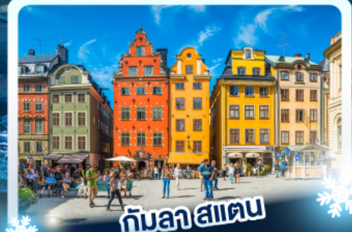
กับลา สแตน