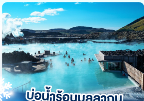
แช่น้ำร้อนบลูลาగుน

เก็บไอซ์แลนด์ เดนมาร์ก สวีเดน และ แช่น้ำร้อนบลูลาగుน