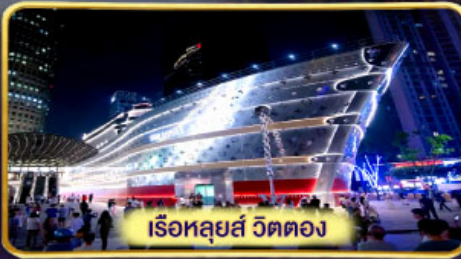
เรือหลุยส์ วิตตอง