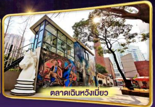
ตลาดเดินหวังเมี่ยว