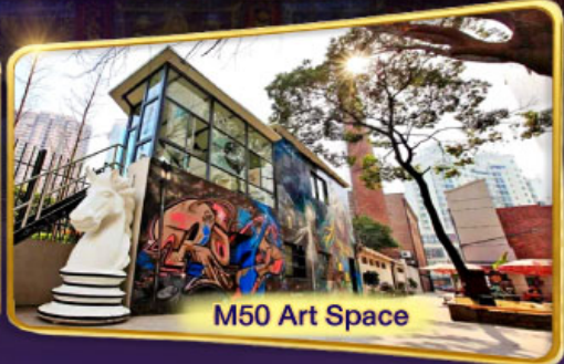
M50 Art Space