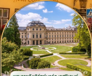
พระราชวังแวร์ซายส์ นคร ปารีส ฝรั่งเศส