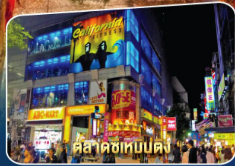
ตลาดซีเหมินตง