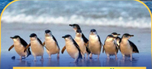
พาหรรณกเพนกวัน