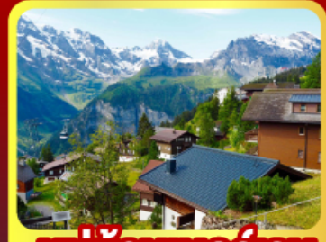
หมู่บ้านมอร์ริส