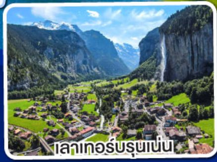
ทะเลเทอร์ซรุชานัน