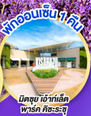
มิตซูเอะอิเกะอิชิอิ พาร์ค คิซึระซึ