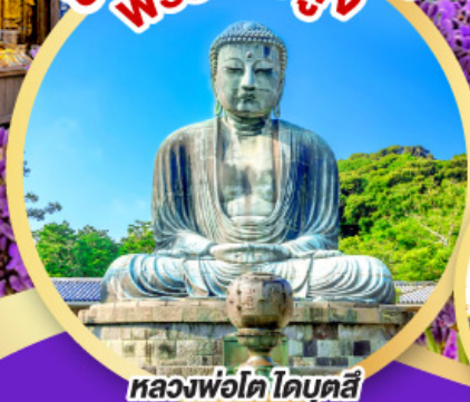
หลวงพ่อดโต โคบุตสึ