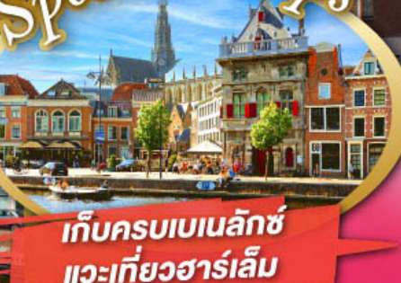
เก็บครบเบเนลักซ์ และเที่ยวฮาร์เล็ม