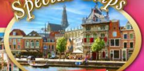
เก็บครบเบเนลักซ์ แะที่ฮาร์เล็ม