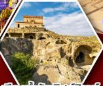
เมืองเก่าอพลิสต์ซิคห์