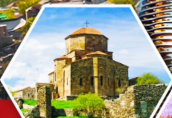
วิหารจอร์