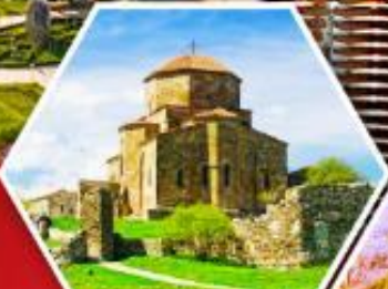
วิหารลอรี