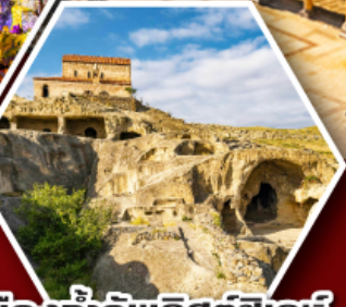
เมืองเก่าอพลิสตีเคห์

พัก Rooms Hotel โรงแรมวิวิลักษณ์ของเทือกเขาคอเคซัส