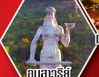
อนุสาวรีย์ มารดาแห่งจอร์เจีย