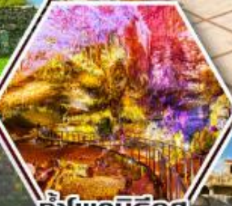
น้ำพอร์บรีอุส