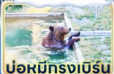
บ่อหมีทรงเบริน