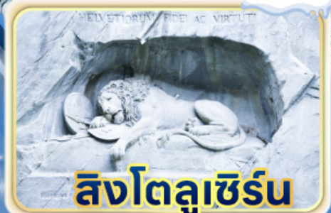
สิงโตลูเซิร์น