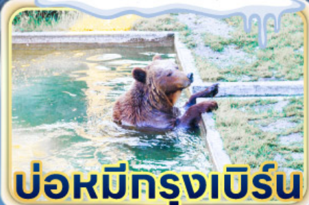
ป้อมมีกรุงเบิร์น