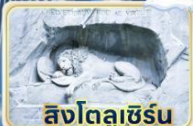
สิงโตลูเชิร์น