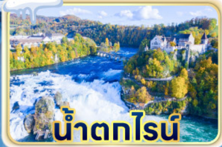
น้ำตกไรน์