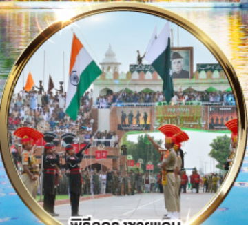
พิธีฉลองชายแดน อินเดีย-ปากีสถาน คำนวากาห์