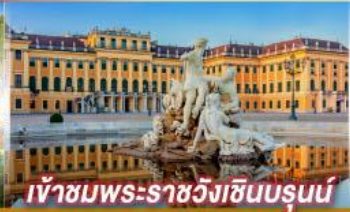
เข้าชมพระราชวังฮินรุนน์