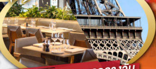
รับประทานอาหารกลางวัน บนหอคอยไอเฟล