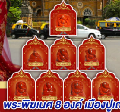
พระพิฆเนศ 8 องค์ เมืองปูณ

" อินเดียครั้งนี้ ไม่ใช่แคทริป แต่คือการเปลี่ยนแปลง ปลุกพลังในตัวคุณ... ด้วยพิธีกรรมศักดิ์สิทธิ์ ณ สถานที่จริง ของพระพิฆเนศ ดินแดนแห่งปญญาและพรสูงสุด"