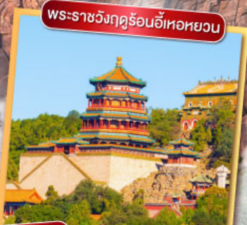
พระราชวังฤดูร้อนอื้อเหอหยวน