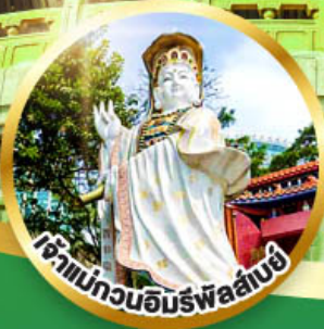
เจ้าแม่กวนอิมพร่ำลั่งบึ้ง