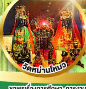
วัดบ้านโท้ว

ขอพรเรื่องการศึกษา, การงาน สติปัญญาและความกล้าหาญ