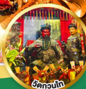
วัดกวนโก