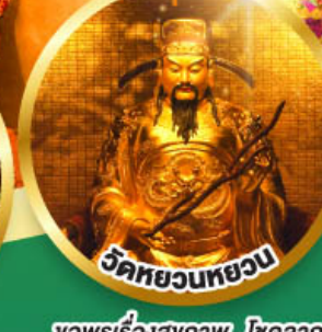
วัดหยวนทวยวน

ขอพรเรื่องสุขภาพ, โชคลาภ ความเจริญก้าวหน้า