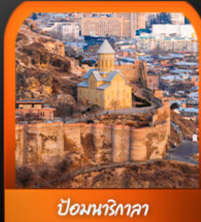
ป้อมนารีทาลา