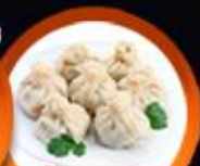
เกี้ยวจอร์เจีย Khinkali