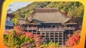
วัดคิโยมิสุเดระ