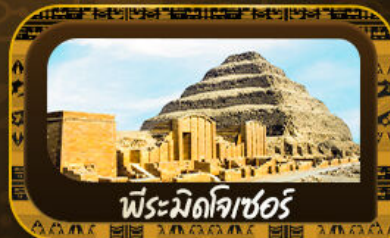
พีระมิดโจเซอร์