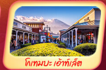
โทกเมบะ เอ้าท์เล็ต