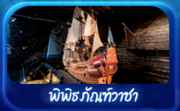
พิพิธภัณฑ์ทัวชา