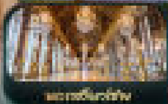
กระเช้าย่องหิมะ

ROME PISA VENCE MILAN COMO LUCERNE JUNGFRAU JOCH PARIS France