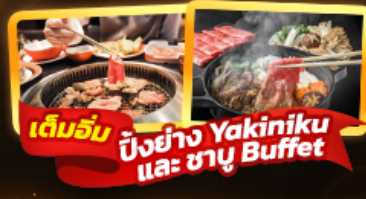
เต็มรับ ปิ้งย่าง Yakiniku และ ซาซึ Buffet