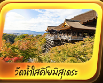
วัดน้ำใสคิโยมิสุเดระ