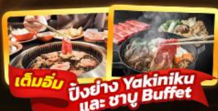
เต็มอิ่ม ปิ้งย่าง Yakiniku และ ชาบู Buffet