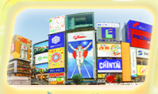
ช้อปปิ้งย่านชินไซบาชิ

สายการบิน VIETJET (VZ) น้ำหนักกระเป๋า 20 KG