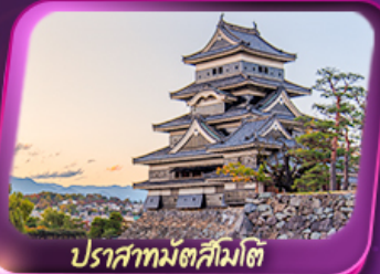
ปราสาทมัตสึมาตี