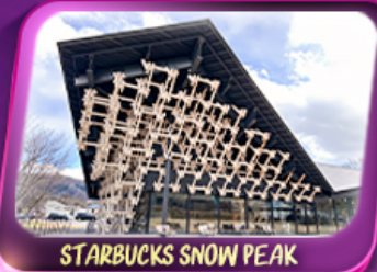
STARBUCKS SNOW PEAK

ครบทุกไฮไลท์เด่นๆ ชมสึซึมพุดินใหญ่ที่ฐานฟูจิซัง! เทศกาลซึซึชะบูระ 1 ปีมีครั้งเดียว ชมความงามหมู่บ้านมรดกโลก หมู่บ้านชิราคาวาโกะ นั่งกระเช้าชมวิว Hakuba Iwatake สัมผัสธรรมชาติที่คามิโมจิ ป้อนเซมเบ็งองทวาง นารา ขอฟรุตโทโดจิ เช็คอินปราสาทโอซาก้า ปราสาทมัตสึมาตี วัดเมียวโดอิน ทะเลสาบซูวะ ถ่ายภาพป้ายกูลิโกะ Starbucks Coffee-Snow peak Land Station ปิดท้ายช้อปปิ้งย่านดัง ชินจูกุ