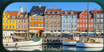
ย่านนูฮาวน์

Really want to see ... Scandinavia Sweden Norway Denmark