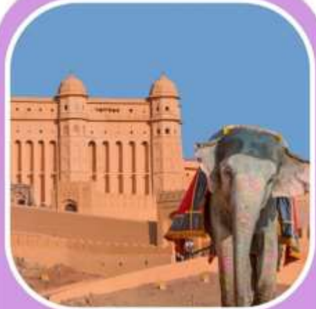
พระราชวัง แอมเบอร์ฟอर्ट