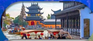
Zhujiajiao Ancient Town ส่องเรือเมืองโบราณ

เชียงใหม่ ดิสนีย์แลนด์ เมืองโบราณจูเจียเจียว