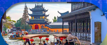
Zhujiajiao Ancient Town ล่องเรือเมืองโบราณ

เซี่ยงไฮ้ ดิสนีย์แลนด์ เมืองโบราณจูเจียเจียว