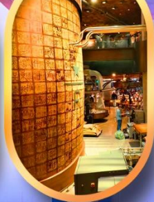
ร้านสตาร์บัคส์