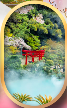
อุมิจิกุ