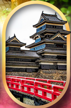
ปราสาทคามาโมโตะ