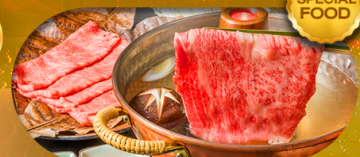
พิเศษเมนู บุฟเฟต์ซาบู