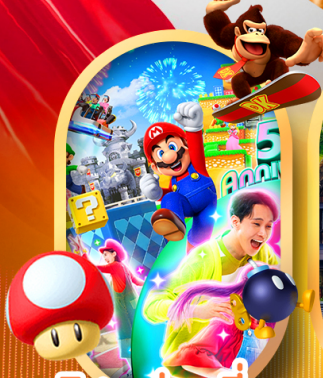
อิสระท่องเที่ยว หรือเลือกซื้อทัวร์เสริม USJ