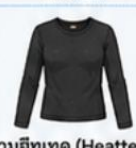
สวมฮีตเทค (Heattech) แบบหนาพิเศษด้านใน