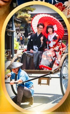
เมืองเก่ากาคายาม่า