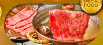
พิเศษเมนู บุฟเฟ่ต์ชาบู