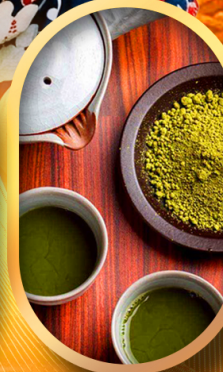
ซงซาแบบญี่ปุ่น