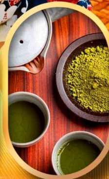
ชงชาแบบญี่ปุ่น