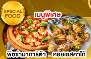
พิซซ่ามาริตต้า หอยแอสคาโก้