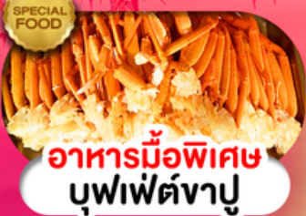
อาหารมือพิเศษ บุฟเฟ่ต์จางู