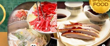
เมนู สุกี้ม้งโก + เปิดปักกิ่ง เดินทาง เม.ษ. - ต.ค. 69