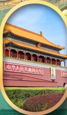
จัสมตรีสเทียนอันเหมิน