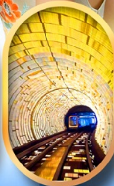
อุโมงค์แมกเลฟ