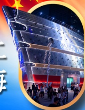
เรือคองคอง