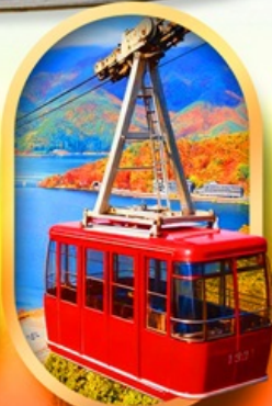
ขึ้นกระเช้าทะเลสาบมิกะตะ