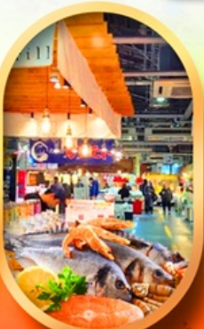
ตลาดปลาฮิองโศ