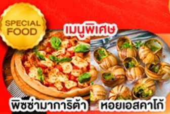
พิซซ่ามาการิตต้า หอยยอสคาโก้