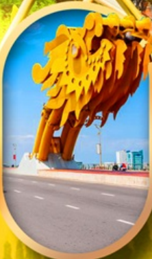
สะพานมังกรดาบิง