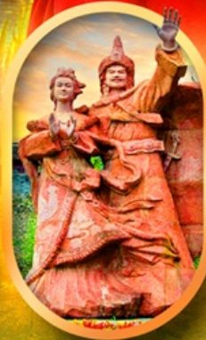
เมืองโบราณชางพาน