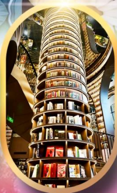
หอหนังสือจุงชูก่อ