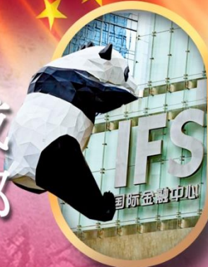
IFS หนีแพนด้าป็นตึก