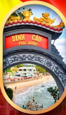
ศาลเจ้าติงเกา